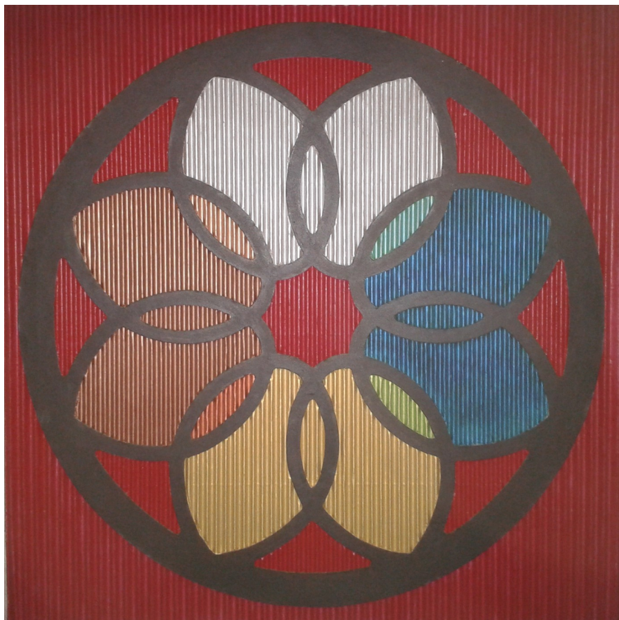
Les quatre phases du cycle menstruel

Clarissa Pinkola Esté, Femmes qui courent avec les loups – Manawee